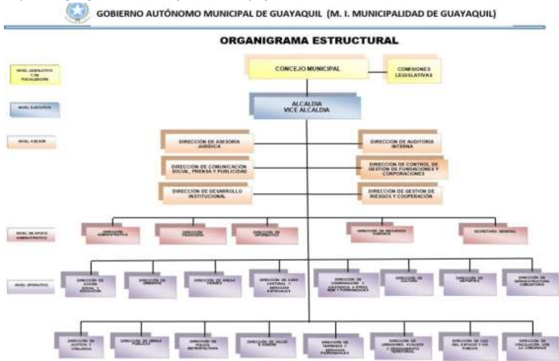
Gráfico 1. Organigrama M.I. Municipalidad de Guayaquil