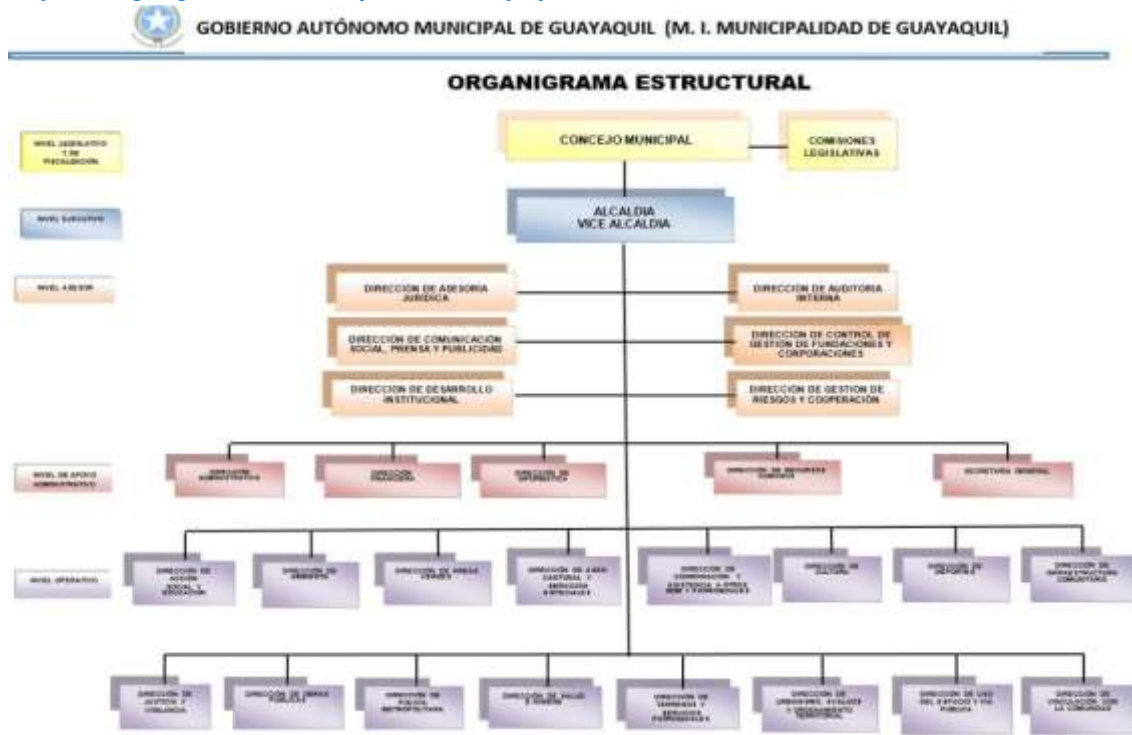
Gráfico 1. Organigrama M.I. Municipalidad de Guayaquil